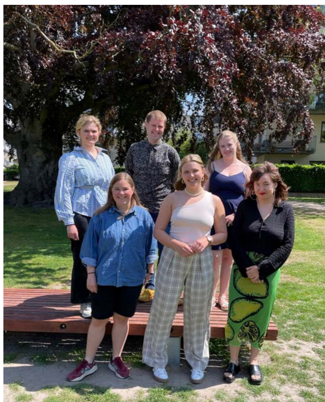
Årets assistenter mødtes i Hamborg.